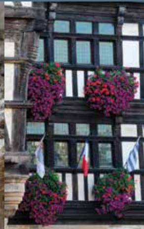
Maisons à pans de bois Place 1830