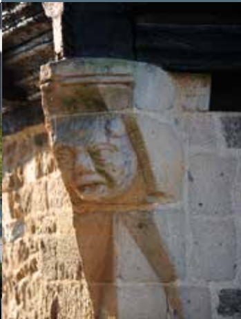
Le «Papa au Lait» ou «Bonhomme Quintin» Place 1830

L'essentiel de chaque panneau est traduit en anglais et en espagnol, et chaque QR Code donne accès à des vidéos sous-titrées et adaptées en langue des signes française et à des fichiers audios.