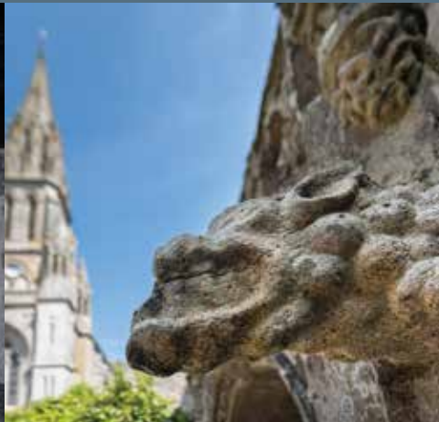
Basilique N.D. de Délivrance et Fontaine N. D. d'Entre les Portes Rue Notre Dame