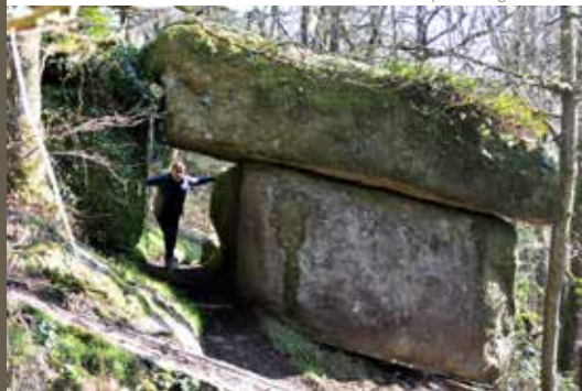
La porte de granit

Situé au bord du sentier à mi-parcours sur votre gauche, ce petit mégalithe témoigne de l'occupation humaine de ce coteau au néolithique. Une hache en diorite a été recueillie à proximité.