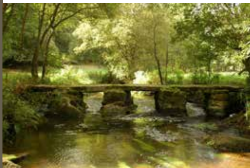
Un pont de granit

Longez le champ par le sentier, et profitez du panorama : de l'autre côté de la vallée se dessine le village de Plaine-Haute.